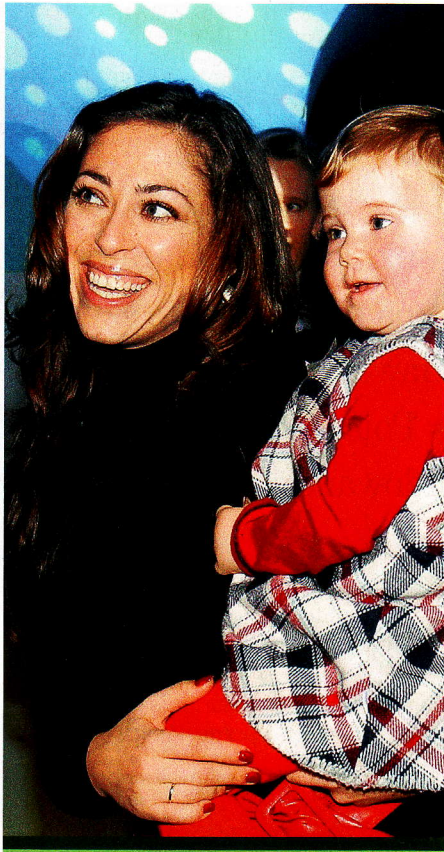
Natalia Kukulska, piosenkarka

Wiadomo, że szczepionka w 70 proc. wypadków nie zmienia przebiegu nabytej