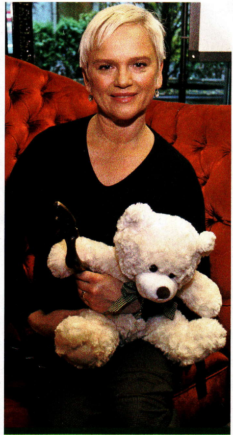
Katarzyna Figura, aktorka

infekcji HPV. Nie leczy także rozwijającego się raka szyjki macicy. Chroni jednak te kobiety, które miały negatywny wynik