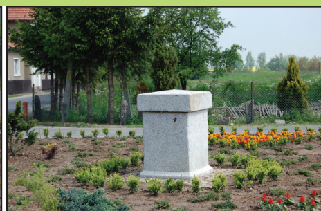
Nowy skwer w Roztoce