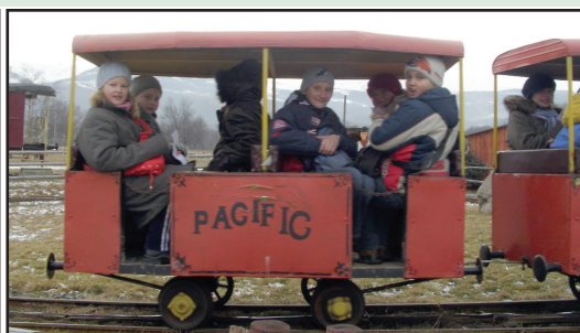
Zimowisko rehabilitacyjno-profilaktyczne