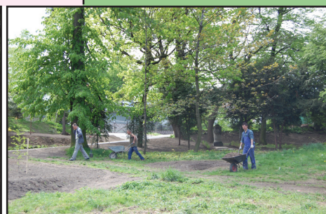
Renowacja parku w Dobromierzu