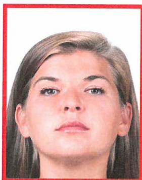
tzw. żabia perspektywa