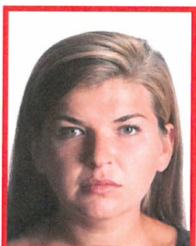
nierównomierne oświetlenie twarzy

Twarz musi być oświetlona równomiernie. Niedopuszczalne są refleksy (odbicia światła na skórze czy włosach powodujące białe plamy w tych miejscach) oraz cienie na twarzy.