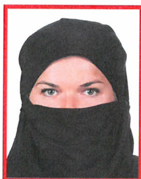
osoba z nakryciem głowy i twarzy