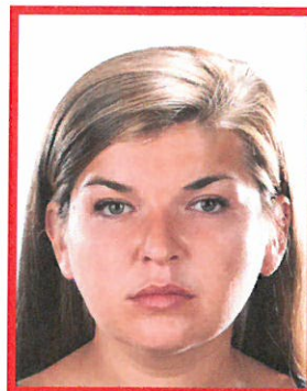
przeświecienia od tła