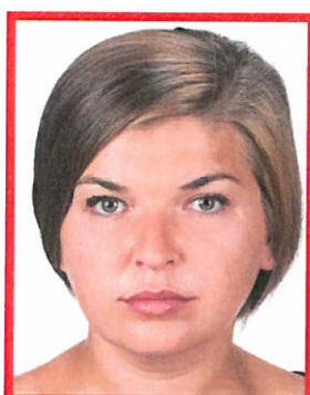
włosy nachodzą na brwi