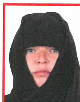
osoba z nakryciem głowy i twarzy