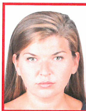
zdjęcie za jasne