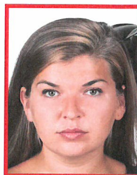
widoczny przedmiot w tle