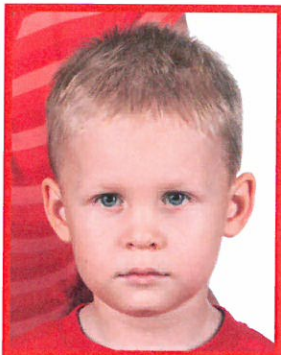
osoba widoczna w kadrze