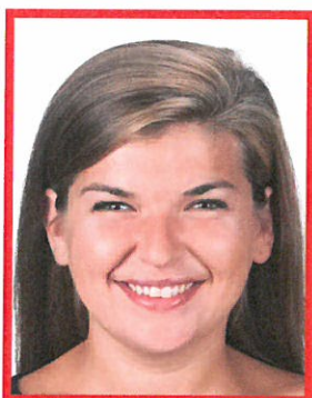
nienaturalny wyraz twarzy