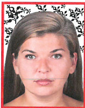
widoczny wzór na tle