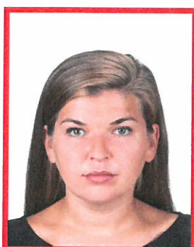
zbyt mała twarz