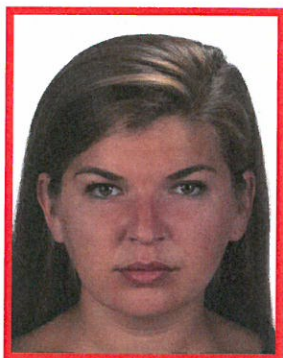
zdjęcie za ciemne