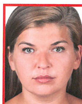
zbyt duża twarz