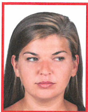
zły kierunek patrzenia

Wzrok osoby fotografowanej musi być skierowany prosto w obiektyw aparatu. Oczy muszą być naturalnie otwarte, wyraźnie widoczne (nie mogą być zakryte przez włosy). Na zdjęciu niedopuszczalny jest efekt „czerwonych oczu”.