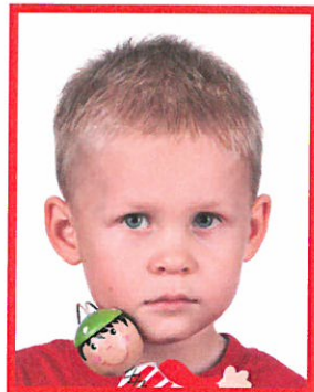
zabawka zakrywająca część twarzy

Należy pamiętać, że w przypadku dzieci do piątego roku życia nie są wymagane zdjęcia wykonywane według zasad obowiązujących przy fotografii osób pozostałych.