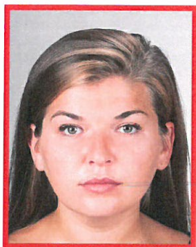
niejednolicie oświetlone tło

Tło białe oświetlone jednolicie, pozbawione cieni i elementów ozdobnych. Zdjęcie musi pokazywać tylko osobę fotografowaną (żadne inne osoby lub przedmioty nie mogą być widoczne).