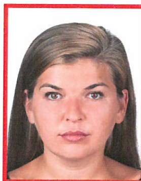
efekt czerwonych oczu